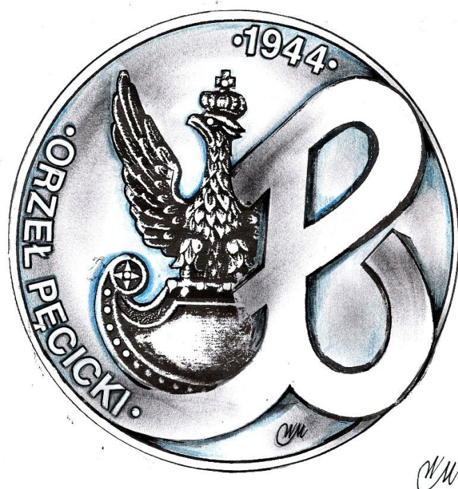
Medal „ORZEŁ PĘCICKI” – awers

W centralnym miejscu POMNIKA –MAUZOLEUM w Pęcicach znajduje się wykonany z brązu odlew orła, dzieło znanej warszawskiej firmę brązowniczej „Bracia Łopieńscy”. Orzeł z pomnika w Pęcicach to Godło Wojska Polskiego II Rzeczypospolitej. Takie orły nosili na czapkach żołnierze polscy w 1920 i 1939 roku.