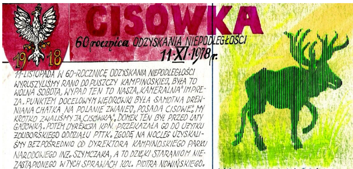
Fragment zapisu w Kronice Komisji Turystyki Pieszej Oddziału Stołecznego PTTK z 11.11.1878 r.

W chwili gdy się ten rajd pojawił w kalendarzu imprez turystycznych w 1973 roku i jeszcze przez wiele lat później pełnej nazwy z wiadomych względów nie można było stosować i nawet nie wszyscy członkowie i współpracownicy KTP Oddziału Stołecznego o niej wiedzieli. Był to temat którego poruszanie z wielu względów było niewskazane i mogło skutkować poważnymi konsekwencjami dla Oddziału a przede wszystkim dla działaczy. Prowadzona przez lata Kronika miała w związku z tym faktem pewne „karty nieoficjalne”. Oto jedna z nich.