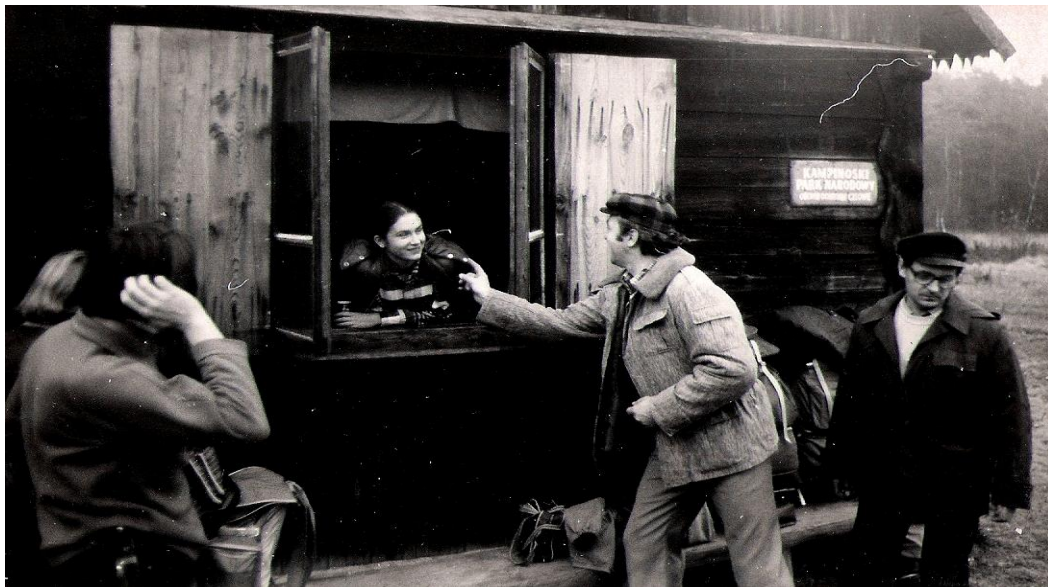
Posada Cisowe 11.11.1978 r.