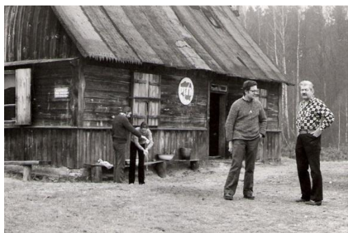
Posada Cisowe 11.11.1978 r.

Noc była piękna, choć zimna, wracając widzieliśmy na bagnach liczne ogniki, słyszeliśmy człapanie łośi. Jeszcze przed chatą małe ognisko, pieczenie kielbasek, piosenki turystycznie i idziemy spać. Jesienne noc była zimna i mroczna. W ciepłej izbie trzaskały szczapy w kominku. Spało się doskonale. Rano po śniadaniu wróciliśmy nieco inną drogą do Polesia Nowego.