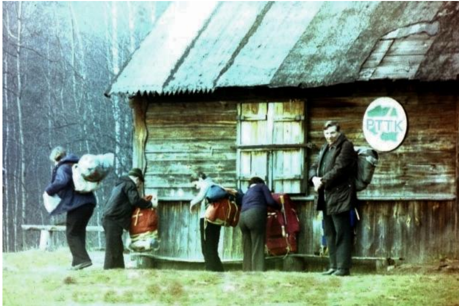
Posada Cisowe 12.11.1978 r.