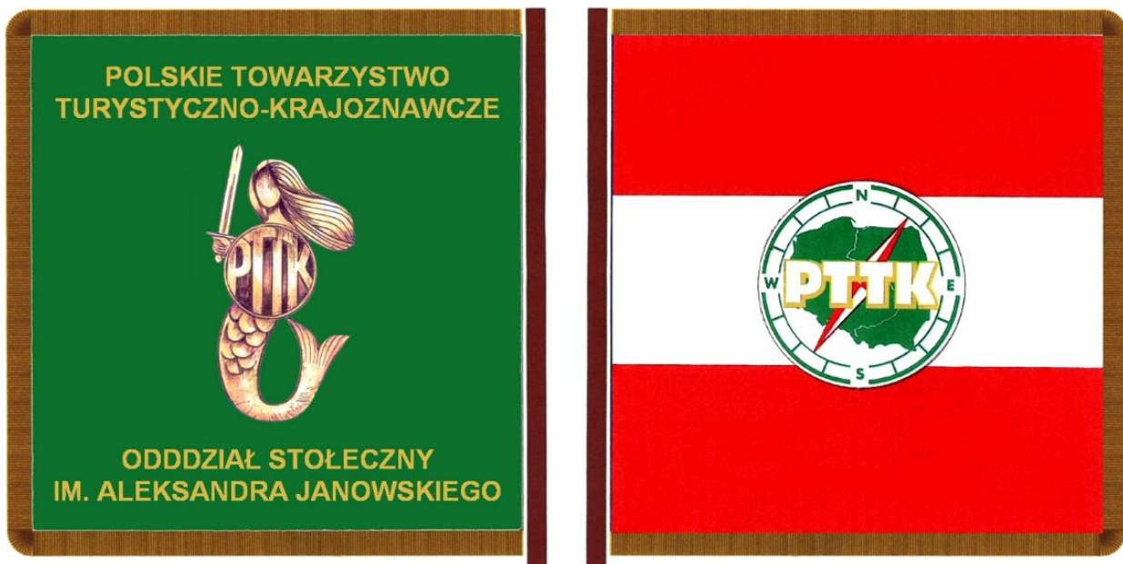
Nowy sztandar Oddziału Stołecznego PTTK

W trakcie mszy dokonano poświęcenia nowego sztandaru Oddziału Stołecznego PTTK. Stary sztandar po ponad półwiecznej służbie pozostanie, jako cenna pamiątka w siedzibie naszego Oddziału.