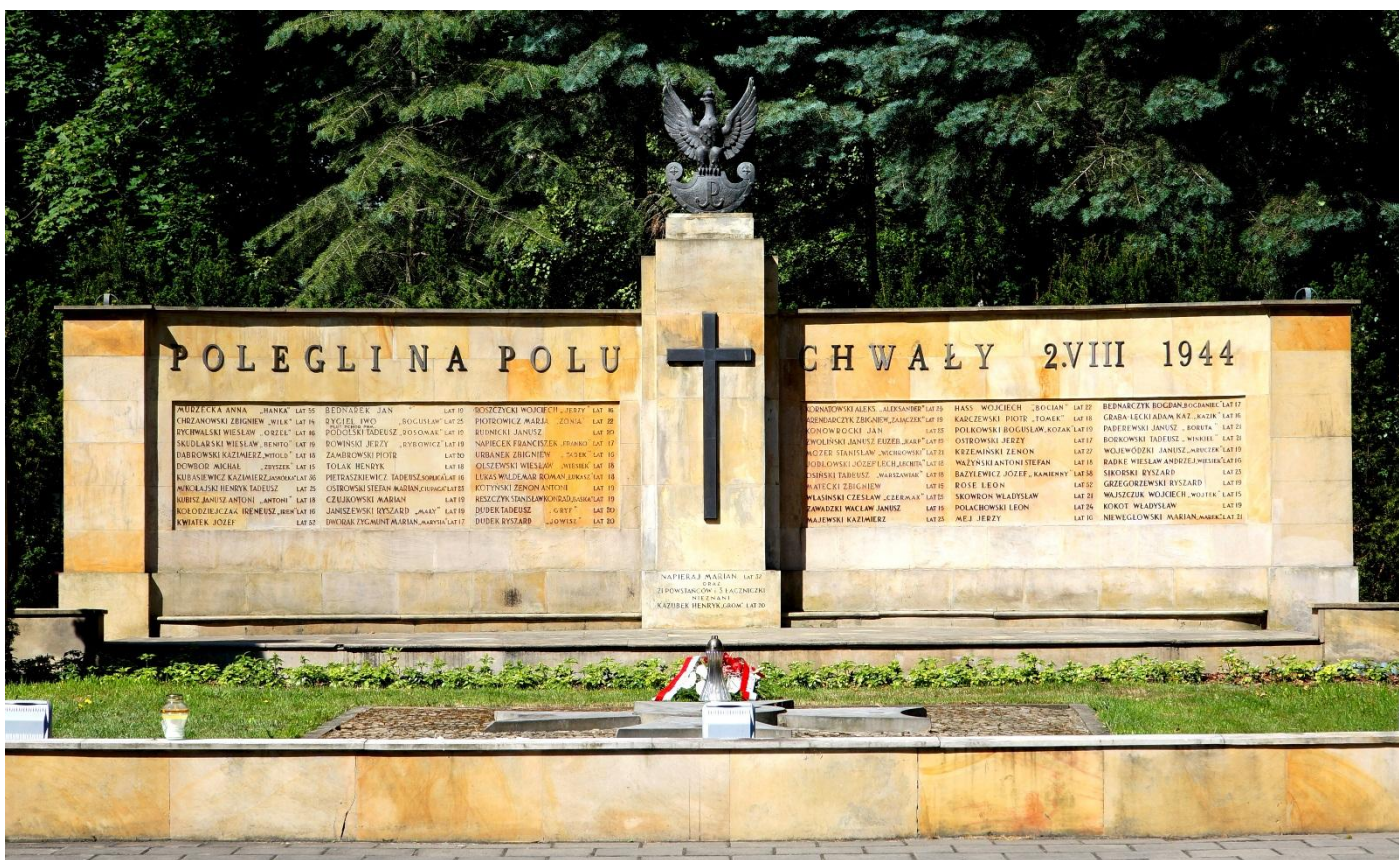
Mauzoleum w Pęcicach