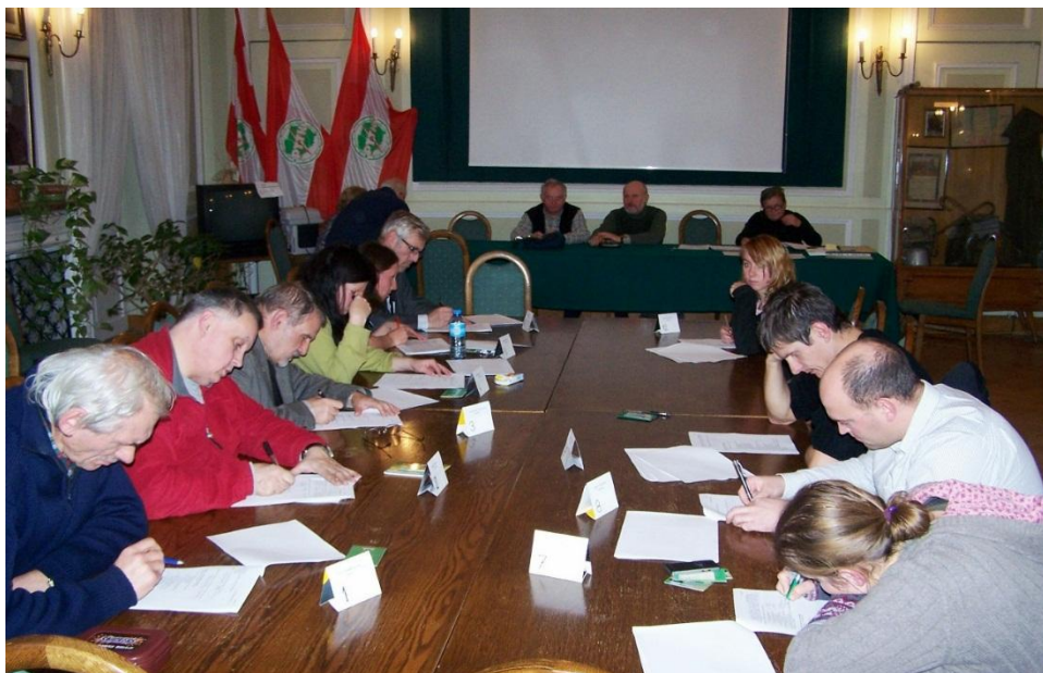
22.11.2011 Egzamin testowy w siedzibie ZG PTTK