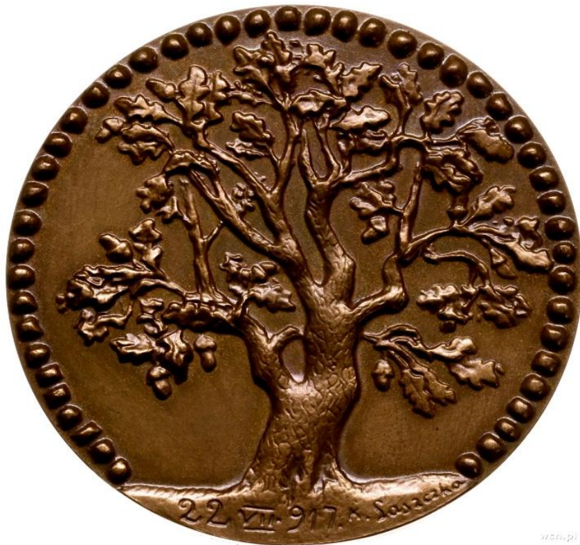
Konstanty Laszczyński, Józef Piłsudski – twórca Legionów , medal wybita w Wiedniu w 1917 r.