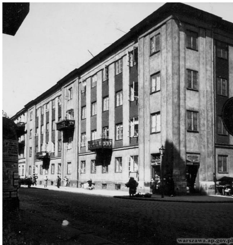
Ul. Chmielna 78 – róg ul. Sosnowa 1 1938 r.