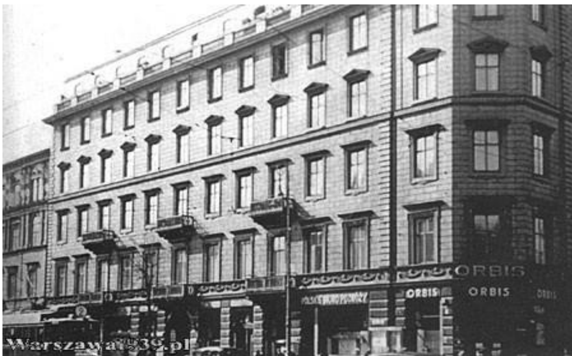
Kamienica przy ul. Marszałkowskiej 153

Siedziba Szkoły Żeńskiej im. Jadwigi Sikorskiej, działającej w latach 1874-1918, w której w latach 1910-1912 wykładał „krajoznawstwo” Aleksander Janowski