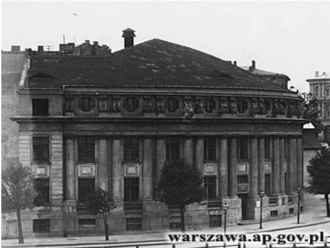
Budynek przy ul. Karowej 31 w latach 30. XX w.