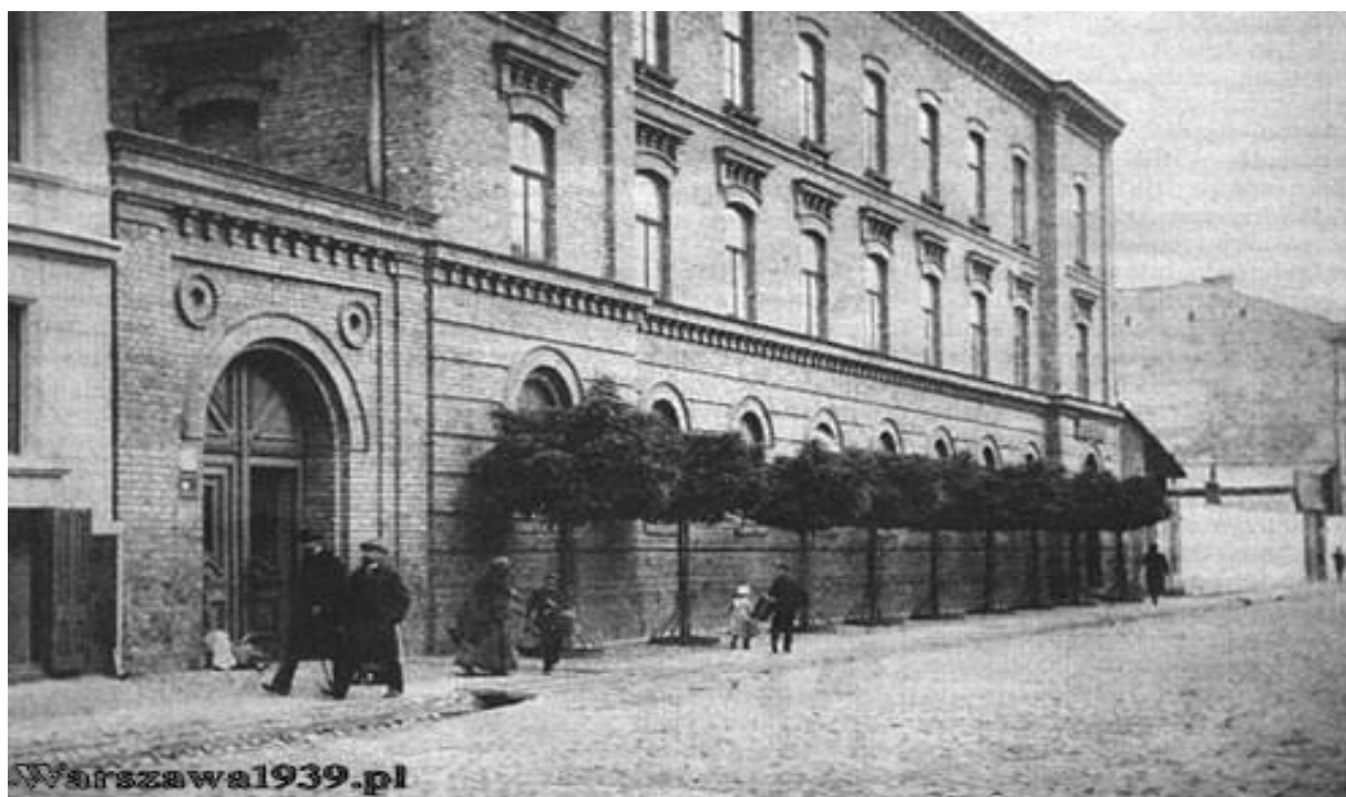
Budynek Szkoły Technicznej Kolejowej Towarzystwa Drogi Żelaznej Warszawsko-Wiedeńskiej mieszczącej się przy ul. Chmielnej 88/90 (lata 1900-1910)