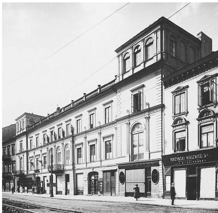
Pałac Kossakowskich w latach 20. XX w.