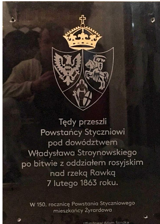
Tablica pamiątkowa przy ul. Bema w Żyrardowie