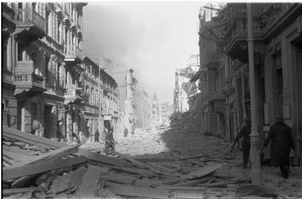
Po lewej kamienica nr 20, 18, 16 i dalsza zabudowa