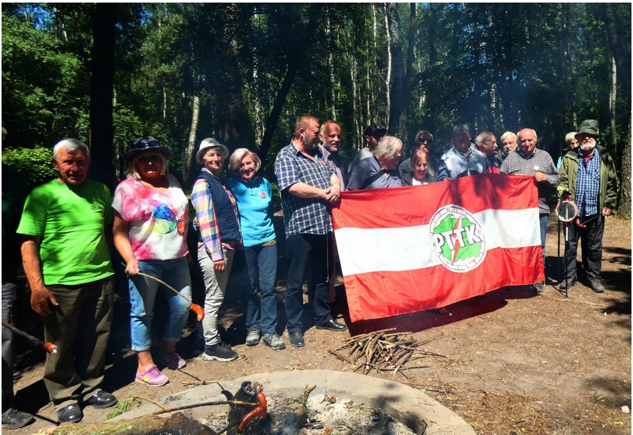
Fot. Włodzimierz Majdewicz