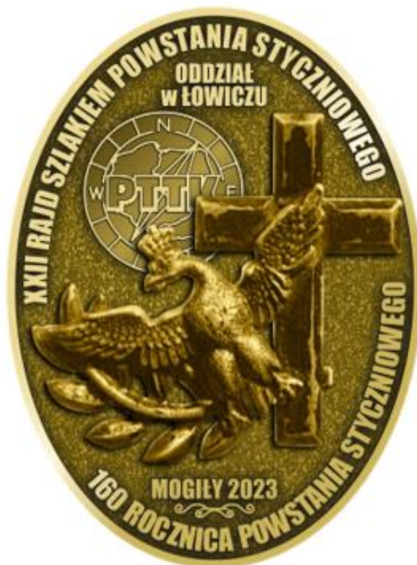
Znaczek rajdowy PTTK Łowicz