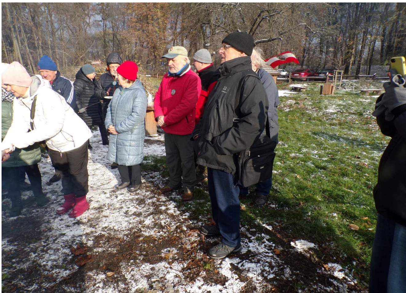
Fot. K. Zaráński