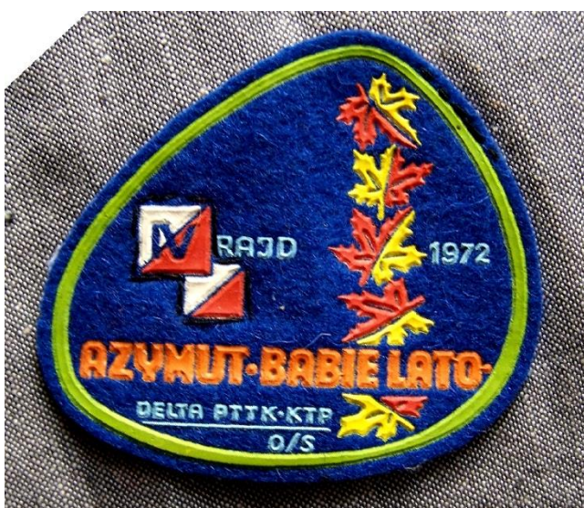
Plakietki organizacyjne członków Klubu Imprez na Orientację PTTK „DELTA”. Pierwsza plakietka została wydana w nakładzie 100 egzemplarzy.