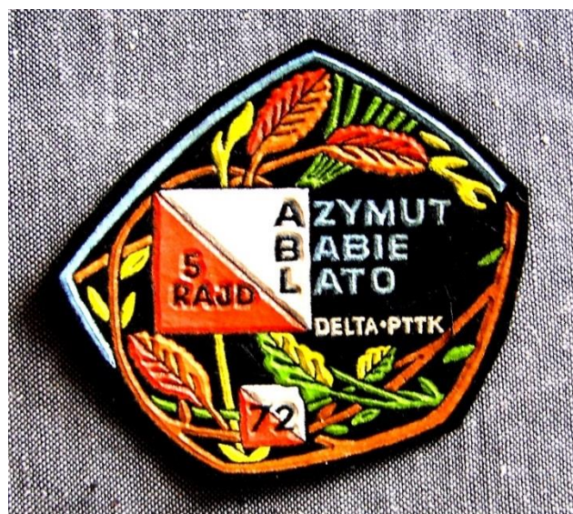
Plakietki z cyklu jesiennych marszów na orientację AZYMUT BABIE LATO. Stołecznych Zawodów na Orientację, Pucharu „Delty” i Nocnych Marszów na Orientację.