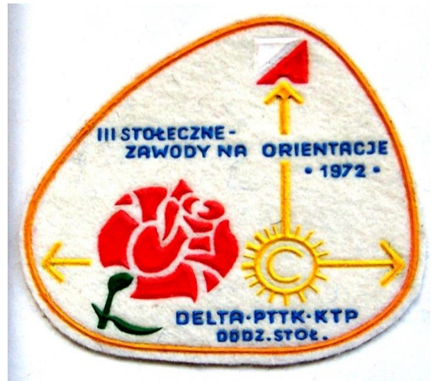
Plakietki Stołecznych Zawodów na Orientację, Pocharu „Deltę” i Nocnych Marszów na Orientację.