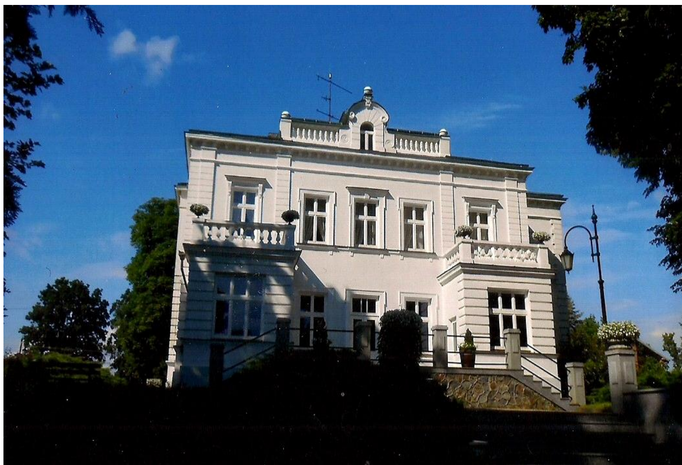
Drozdowo – widok od strony parku.

Sam budynek i jego wspaniała z wielkim smakiem urządzona ekspozycja znajdują się w równie wspaniałym ogrodzie, parku angielskim i francuskim z bardzo bogatym, różnorodnym i zróżnicowanym drzewostanem i kąciem zielarskim. W sąsiedztwie budynku muzealnego w oficynie na znacznej powierzchni zaprezentowano przebogaty świat ziół i roślin uprawnych.