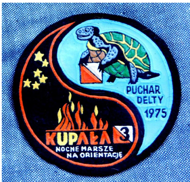
Plakietki z imprez organizowanych przez Klub PTTK InO Delta.