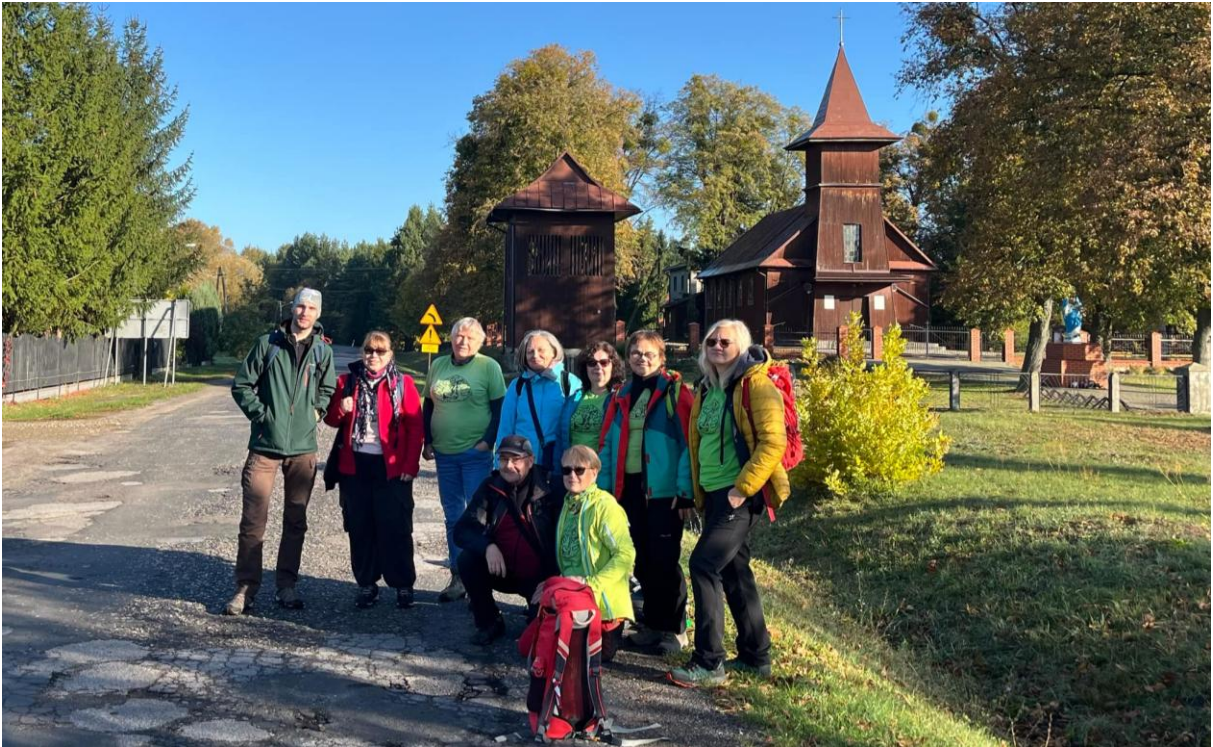
Uczestnicy I trasy w Wytocznie

Dalsza część uroczystości upłynęła przy dźwiękach muzyki, zapachu pieczonych kiełbasek oraz szumu drzew Poleskiego Parku Narodowego.