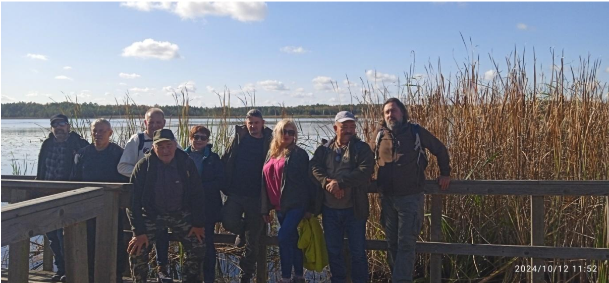
Uczestnicy trasy III nad jez. Łukie w obrębie Poleskiego Parku Narodowego