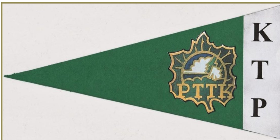
Rekonstrukcja proporca KTP ZG PTTK

Wielkopolski i Ziemi Lubuskiej. Impreza trwała od 5 do 18 sierpnia 1957 r. z zakończeniem w Łagowie Lubuskim.