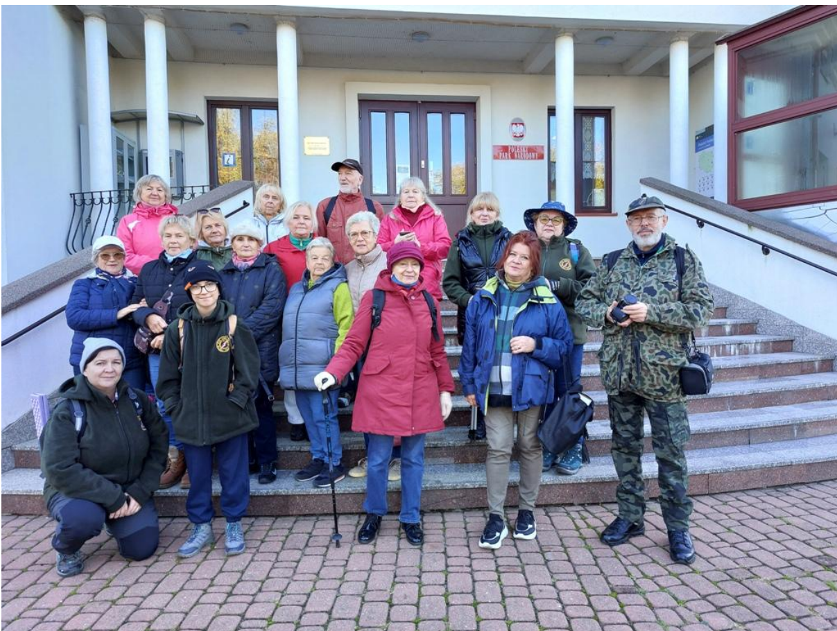
Uczestnicy IV trasy przed siedzibą Poleskiego Parku Narodowego w Urszulinie