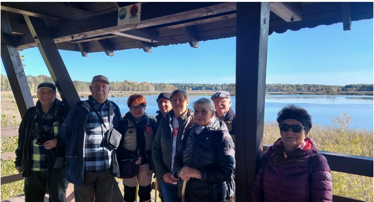
Uczestnicy trasy II na wieży widokowej na ścieżce PPN „Perehod”