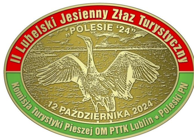
Pamiątkowy znaczek II Lubelskiego Złazu Turystycznego „Polesie ‘24”