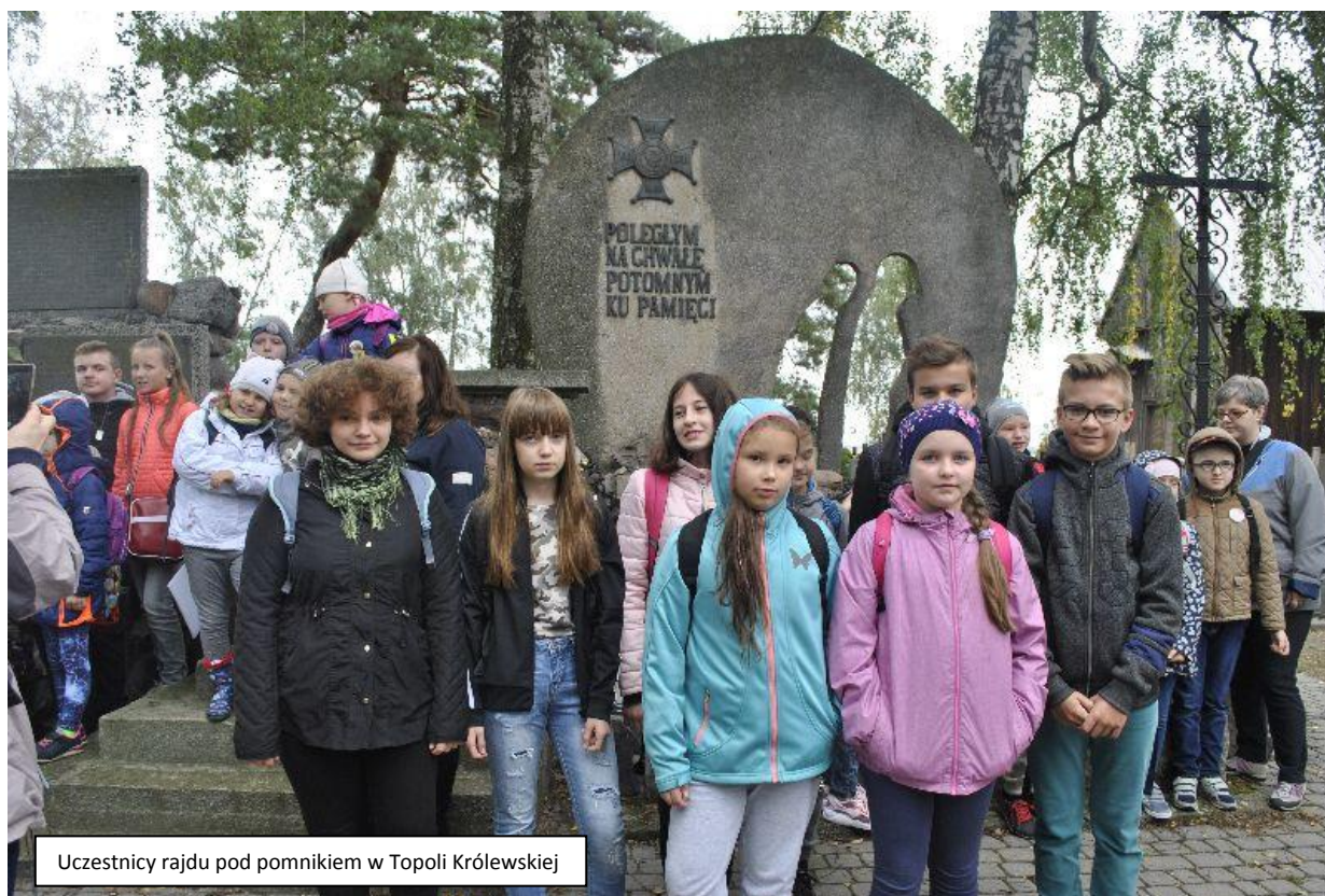
Uczestnicy rajdu pod pomnikiem w Topoli Królewskiej

Rajd „Szlakiem Bohaterów Walk nad Bzurą” wpisał się na stałe w kalendarz imprez turystycznych organizowanych przez Oddział PTTK „Ziemi Łęczyckiej” w Łęczycy. Jak zawsze we wrześniu, w rocznicę najkrwawszej bitwy 1939 r., sympatycy turystyki pieszej z województwa łódzkiego oddają hołd poległym w obronie Ojczyzny. Tegoroczny rajd został zorganizowany 16 września 2017 r., przy współpracy Miejskiej i Powiatowej Biblioteki Publicznej w Łęczycy, Urzędu Miejskiego w Łęczycy oraz Muzeum w Łęczycy. Był ostatnim z cyklu czterech rajdów, jakie przeprowadzono wspólnie z Miejską i Powiatową Biblioteką Publiczną w Łęczycy pod hasłem: „Podróże po regałach”, w ramach programu „Partnerstwo dla książki 2017”, dofinansowanego z Ministerstwa Kultury i Dziedzictwa Narodowego. W rajdzie wzięło udział 284 uczestników z 12 szkół podstawowych, 5 gimnazjów, 1 szkoły średniej oraz turyści indywidualni.