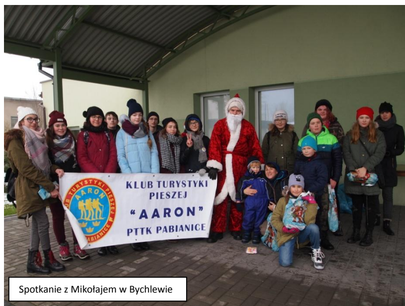
Spotkanie z Mikołajem w Bychlewie

Na spotkanie z Mikołajem wyruszyły również drużyny: SP nr 5, 8, 16, 17, Gimnazjum