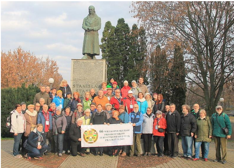
Zdjęcie grupowe uczestników przy pomniku Stanisława Staszica w centrum Pily