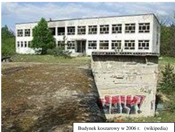
Budynek koszarowy w 2006 r.

Wojsko dość szybko zabiera się do pracy. Wszystko otoczone jest tajemnicą ale miejscowi wiedzą, że wznoszone są, a raczej wkopywane w ziemię, jakieś bunkry. Ich przeznaczenie do dziś budzi emocje. Najczęściej mówi się o Atomowej Kwaterze Dowodzenia, jednak wszystko wskazuje na to, że było to jedno z kilku zapasowych stanowisk dowodzenia stworzone na wypadek wojny atomowej.