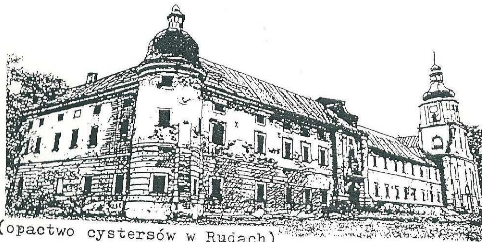
(opactwo cystersów w Rudach)

Ogólnopolskiego Wysokokwalifikowanego Rajdu Pieszego